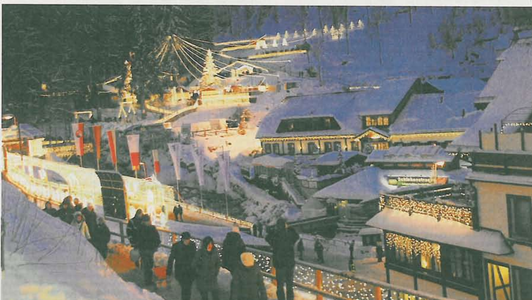
In all seiner Schönheit bietet das Weihnachtszauberland in diesen Tagen einen prächtigen Anblick. Mit viel Liebe zum Detail haben die Organisatoren die Voraussetzungen für märchenhafte Winterstimmung geschaffen.