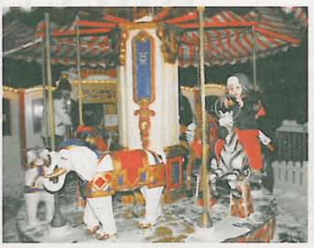
Das kleine Karussell sorgt bei den Kinder für Kurzweil. Mit ihm hatten sich die Veranstalter eine weitere Besonderheit ausgedacht.