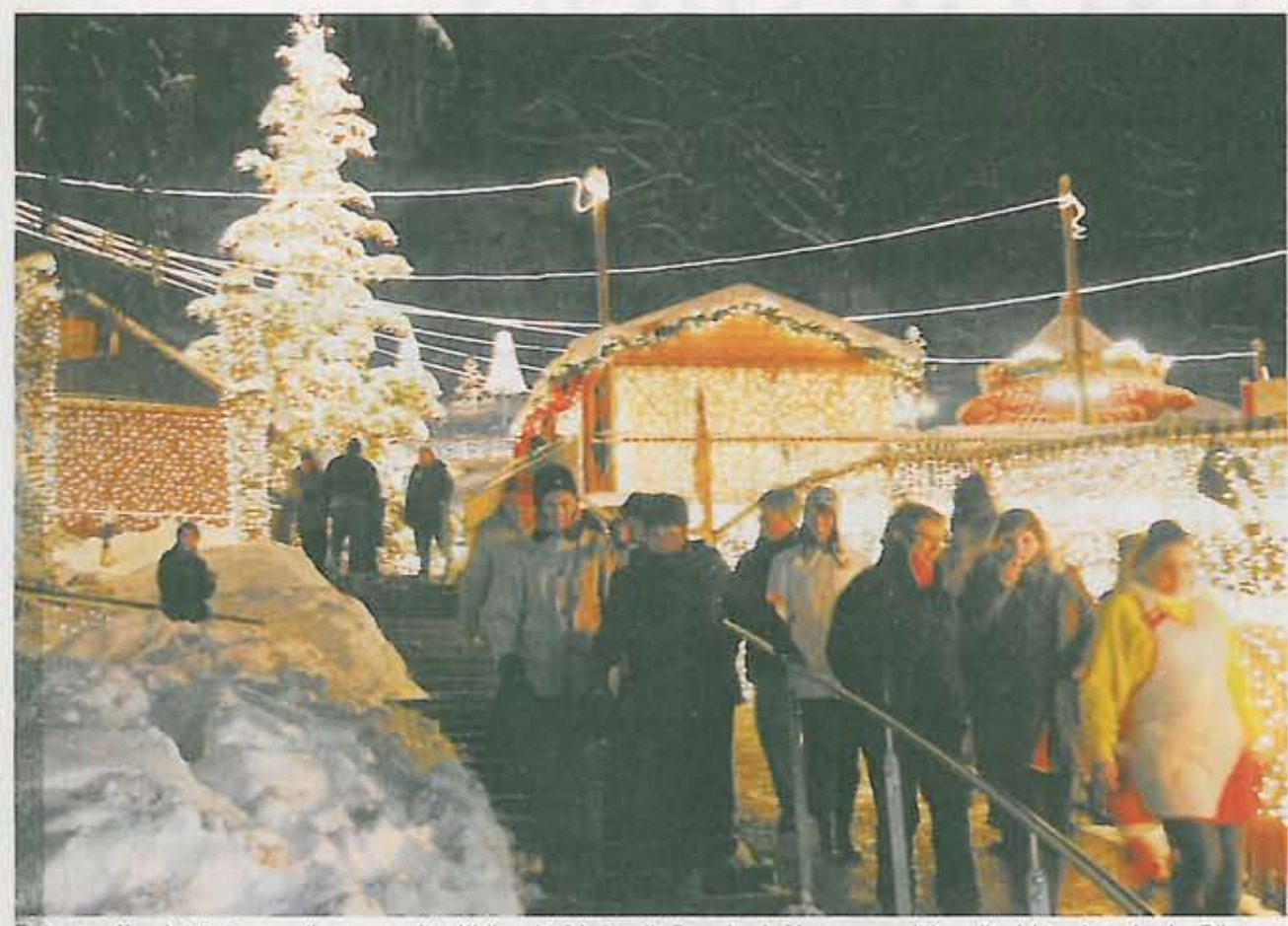
Erst gegen Abend strömten vor allem am zweiten Weihnachtsfeiertag die Besucher in Massen zur mittlerweile siebten Ausgabe des Triberger Weihnachtszaubers.