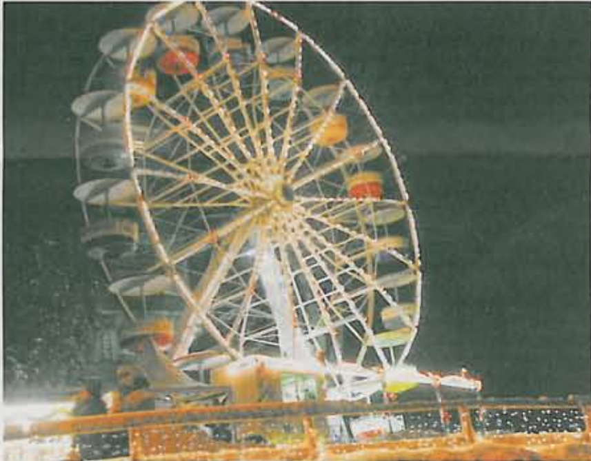
Für einen unvergesslichen Ausblick über Triberg und das wunderschöne Weihnachtszauberland sorgt das 30 Meter hohe SÜDKURIER-Riesenrad.