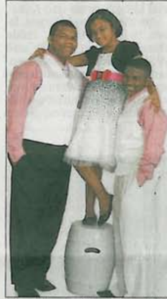
Einen Riesenerfolg in den USA hatte die Gesangsgruppe »Voices of Glory«.