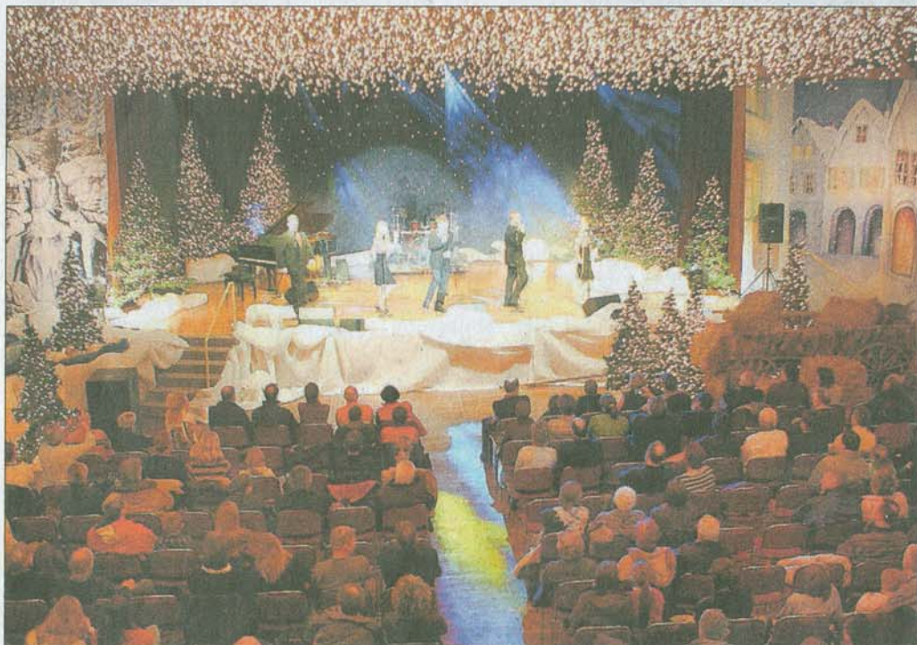
Auf der Bühne des Triberger Weihnachtszaubers machen namhafte Stars ihre Aufwartung.

Bei einem reichlichen Angebot an Getränken, Speisen und Leckereien wird der Aufenthalt beim Triberger Weihnachtszauber zu einem besonderen Erlebnis für die ganze Familie. Weitere Infos gibt es unter www.triberger-weihnachtszauber.de