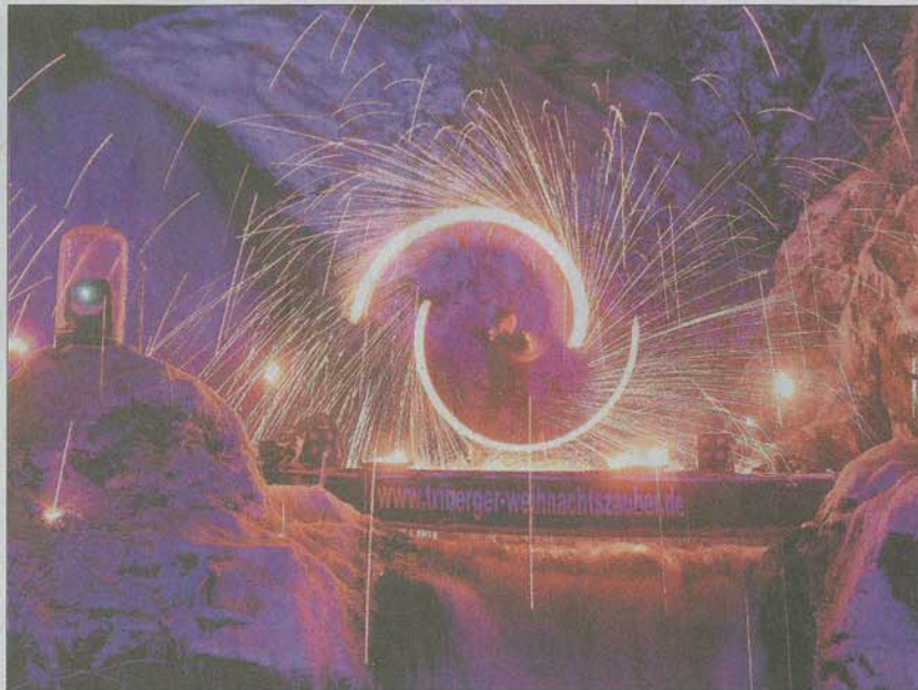
Phantastische Illuminationen und heimisches Handwerk: das gibt es auch dieses Jahr wieder beim Triberger Weihnachtszauber zu bestaunen, der nach Weihnachten erst so richtig loslegen wird.