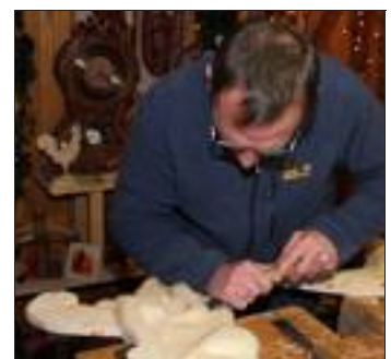
Des artisans montrent le savoir-faire traditionnel de Forêt-Noire : sculpteur sur bois, peintre d'horloge, vannier, etc.