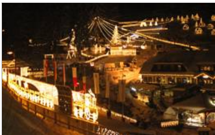
900 000 lumières éclairent l'étonnant village de Noël.