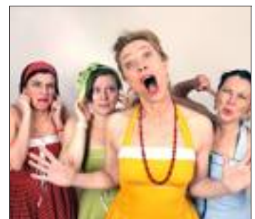
De nombreux artistes se produisent sur les deux scènes. Parmi eux, les « Zuckerröhren », quatre femmes qui remixent des chants de Noël avec leurs propres créations déjantées.