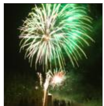
Un feu d'artifice illumine le ciel lors de quatre soirées.

Programme complet sur www.triberger-weihnachtszauber.de